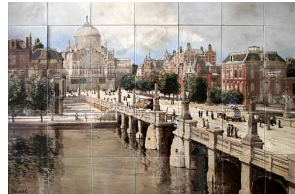
De Distel, tegeltableau, Gezicht op Amstel en Paleis van Volksvlijt, schilder W.G.F. Jansen, 1915, 106,4x76 cm; coll. Meentwijck

Rechts: PZH, Model 3103, vaas, unicum spatglazuur, ontw. W. Muller-H. Verlee, 1931, h. 23 cm; coll. fam. Branolte