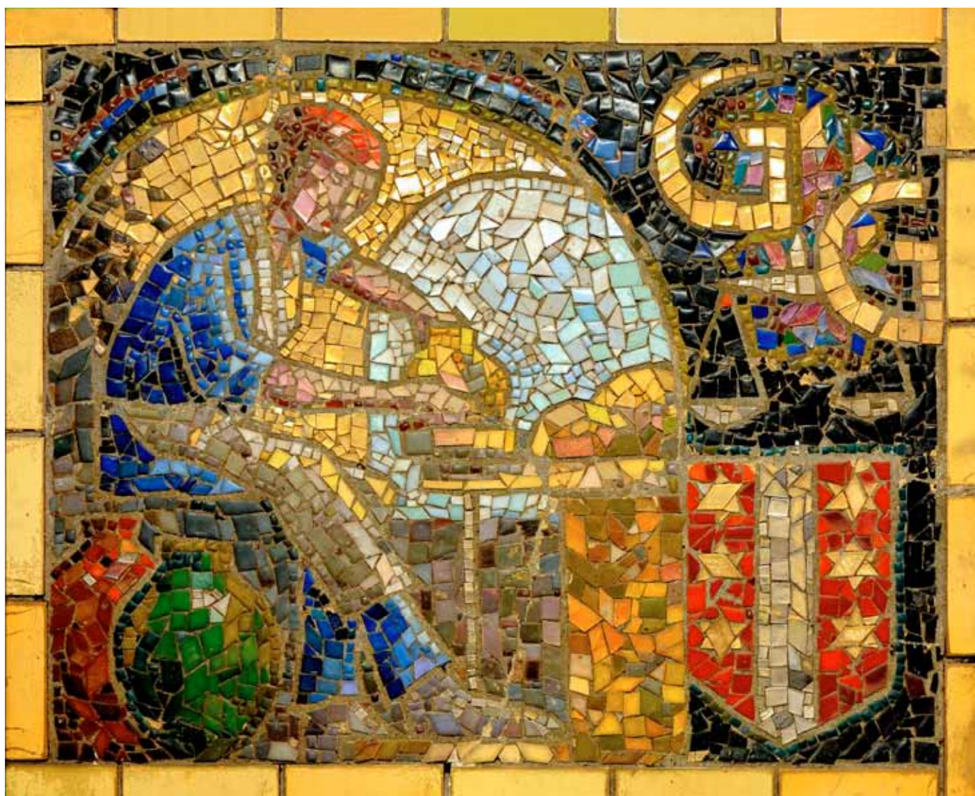
Goedewaagen, mozaïek, Pottendraaier, W.H. van Norden, ca 1934, voorheen entree fabriek; coll. B. J. Baas