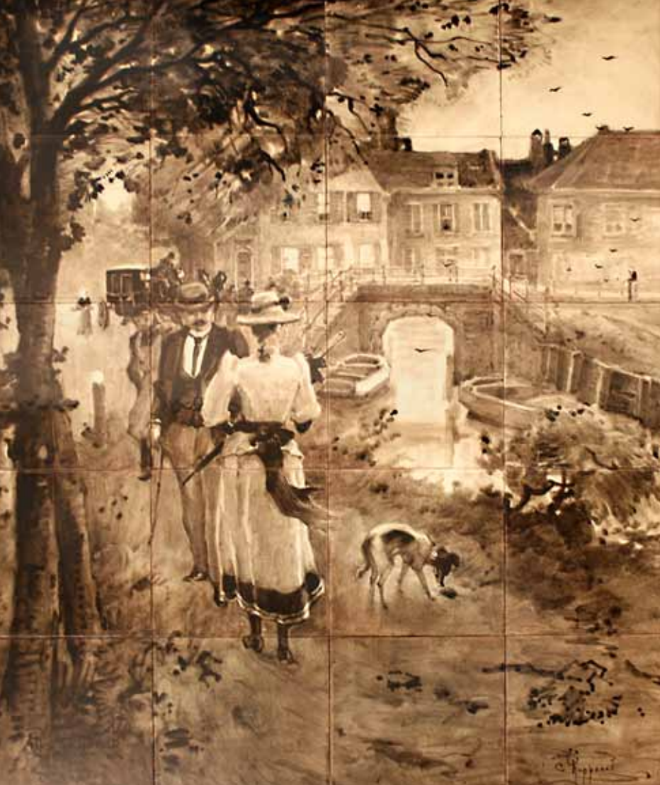
Links: Rozenburg, tegeltapeau, Flaneur-paar, schilder C. Koppenol, ca 1892, 76x60,8 cm; coll. Meentwijkstra