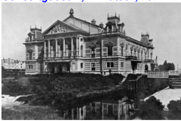
Architect Dolf van Gendt, april 1888