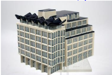
McKinsey, Amstel 344, 1960-1972