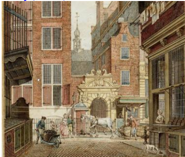
Kleinste huisje, 10 m2, in 1787