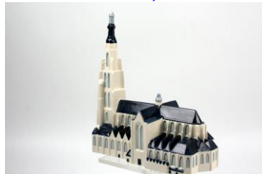
Grote of Oranje Nassau-kerk, Breda, Brabantse gotiek, 1410-1547, miniatuur 2014