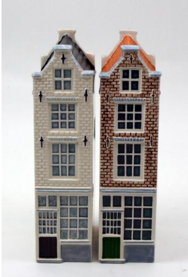
Oude Hoogstraat 22, Asd, kleinste huisje, 1737, miniaturen 2014