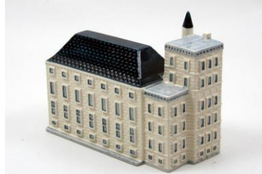
Eerste Kamer, miniatuur, 2014