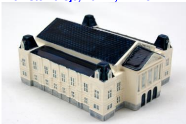
Concertgebouw, miniatuur, 2012