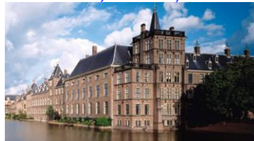
Eerste Kamer-gebouw, Den Haag, architect Pieter Post, 1651