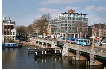
McKinsey, Amstel 344, 1960-1972