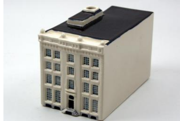
d'Bruynvis, 1762, miniatuur 2013