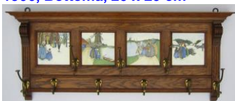
5. Potterij Rembrandt, Utrecht, eikenhouten kapstop met 4 streekdrachttegels