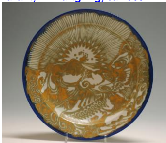
8. PZH, Japonaiseri H. Breetvelt