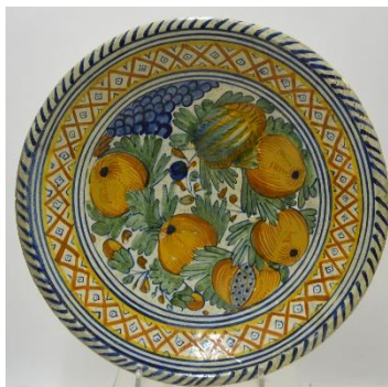
Granaatsppels, diam. 33,5 cm