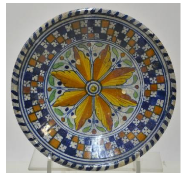
Delfts, 21,3 cm