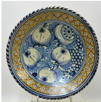
Granaatappels, diam., 31,5 cm