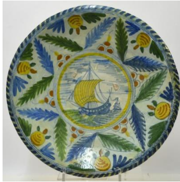
Scheepsmotief, diam. 34,5 cm

De oud-Nederlandse majolica wordt onder verwijzing naar de Toscaanse stad Faenza ook als faïence betiteld.