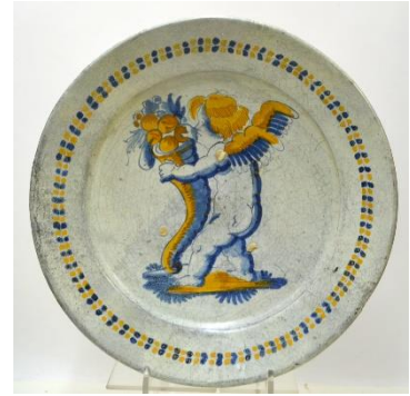
Putto met hoorn des overvloeds, diam. 31,2 cm