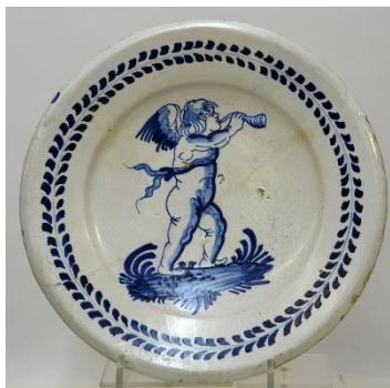
Putto als heraut, diam. 27,6 cm