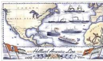
Goedewaagen, ontwerp tegelta-Bleau voor Rotterdam VI, 1998, ontwer Sander Alblas