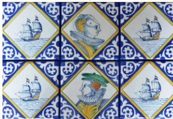
Albarellio, tegeltableau, MS Westerdam, 2003