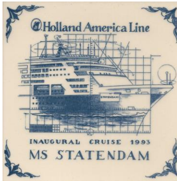
Goedewaagen, MS Statendam, 1993