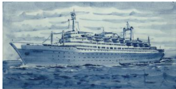
PZH, MS Rotterdam V, ca 1959