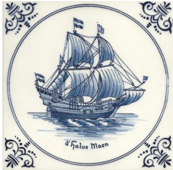
Goedewaagen, jaren 60, d' Halve Maen, Hudsons schip, 1609