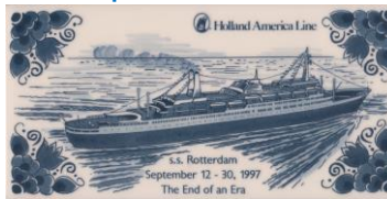
Goedewaagen, MS Rotterdam V, the End of an Era, 1997