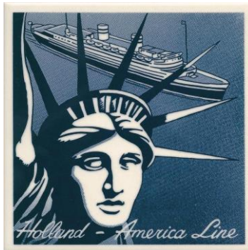
Goedewaagen, Mariner-tegel naar Art Deco-poster