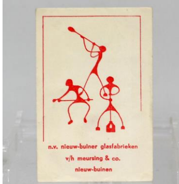
VH Meursing, suikerzakje met logo