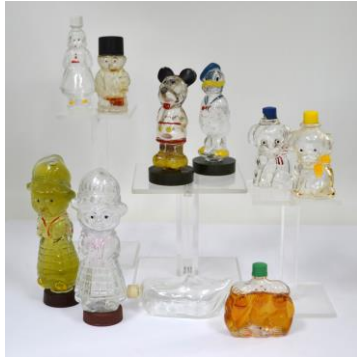
VH Meursing, figuratieve parfum-flesjes, jaren 50