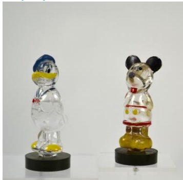
VH Meursing, Disney-flesjes