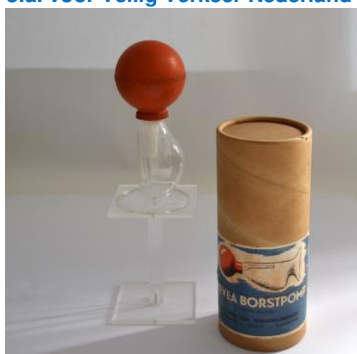
VH Meursing, Afkolffles voor moedermelk met verpakking