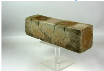
VH Meursing, ovensteen na de sloop van 1967