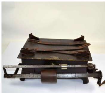
Glasfabriek Bakker, weegschaal