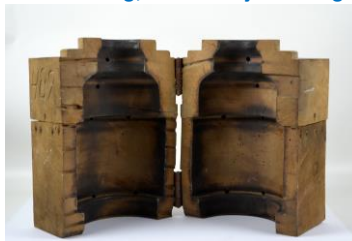
Verenigde Glasfabrieken, perenhouten mal