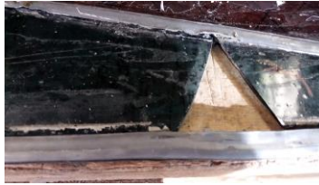
Diverse breuken in het originele glas vroegen om een stijlvolle oplossing