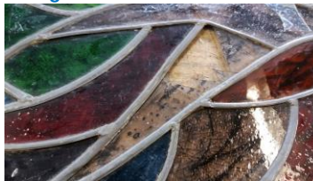
Een ander verdwenen stuk glas