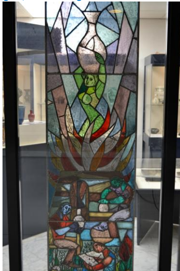
Allegorische voorstelling van de ontwerper, pottenbakker en het vuur, ca 1923