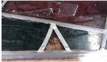
en die werd gevonden door de glasscherf in nieuw lood te zetten