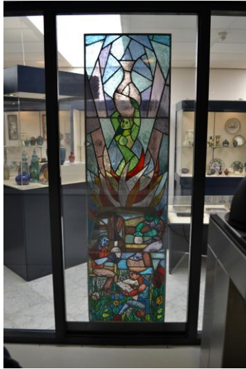
Keramisch Museum Goedewaagen, Art Deco glas-in-lood-raam