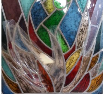
Her en der ontbraken stukken gebrandschilderd glas, zoals gier in het segment van het vuur