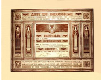
Den Haag, 1904