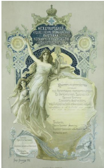
St. Petersburg, 1901, goud