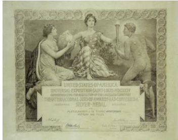
Wereldtentoonstelling Louisiana, 1904, zilver