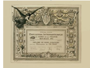
Roubaix, 1911 Turijn, 1911

Verder waren er diploma's van Oostende, 1911 en Berlijn, 1911