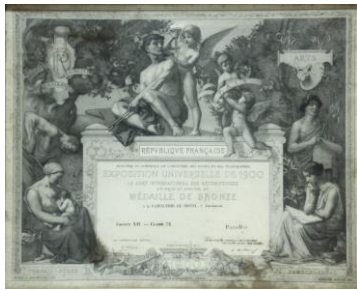
Wereldtentoonstelling van Parijs, 1900