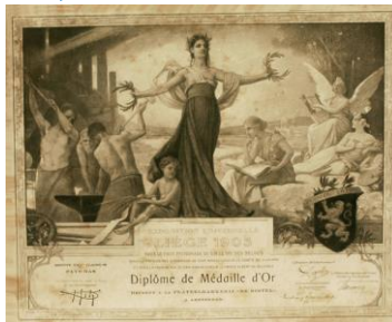
Wereldtentoonstelling Luik, 1905 (coll. Ned. Tegelmuseum)