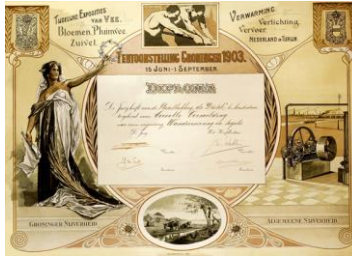
Groningen, 1903