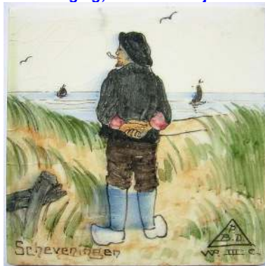
PBD, tegel, streekdracht Scheveningen; coll. Bert-Jan Baas (vitrine)