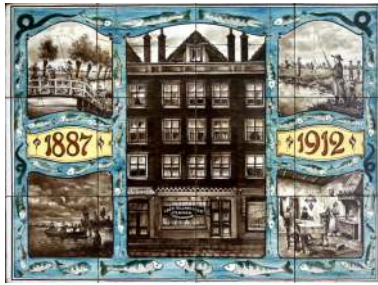
PBD, Café Marnixstraat, 25 jaar visvereniging