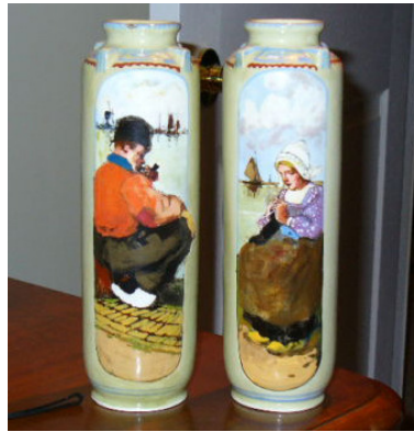
PBD, kruiken, streekdracht, Corn. de Bruin; coll. Bert-Jan Baas (vitrine)