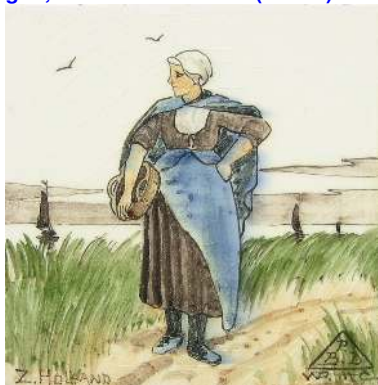
PBD, tegel, streekdracht Zuid-Holland; coll. Bert-Jan Baas (vitrine)