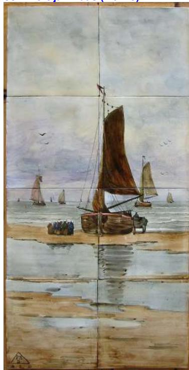
PBD, tegeltableau, Scheveninger bom, naar H.W. Mesdag; coll. Bert-Jan Baas (in ontvangsth)