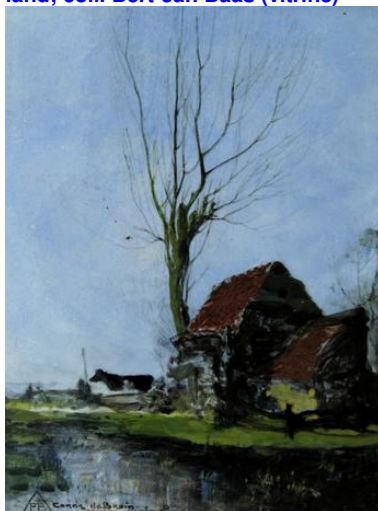
PBD, tegelplaat, Boerderij, Corn. De Bruin; coll. Bert-Jan Baas