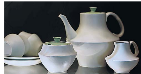
Van boven naar beneden: servies Athene en servies Blue Sky uit de collectie van Ellen, en Muizenissen uit de collectie van het museum.