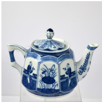
MOSA, Langelijs-theepot voor NASM met pseudo Chinees merk, voor 1900