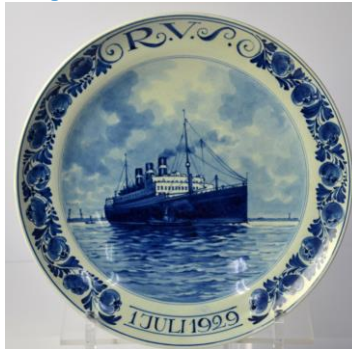
Porceleyne Fles, Statendam, 1929, uitgave verzekeraar R.V.S; verzekerde som Hfl. 300 miljoen.