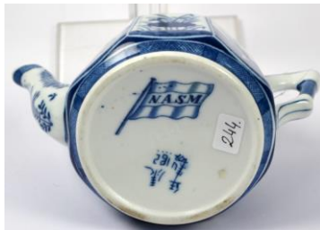
MOSA, Langelijs-theepot voor NASM met pseudo Chinees merk