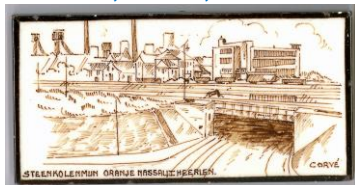
Heerlen, Oranje Nassau Mijn, J. Corvé