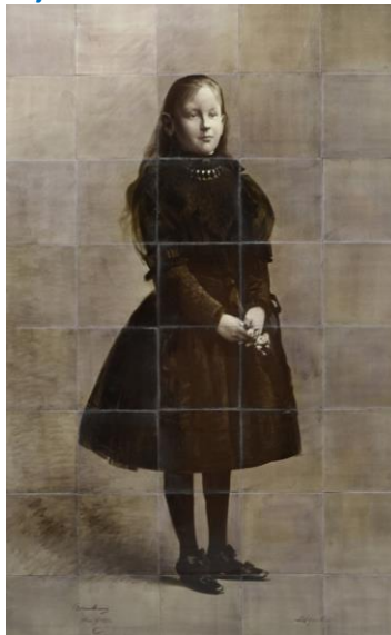
Daniël Harkink, prinses Wilhelmina in rouwdracht, 1891