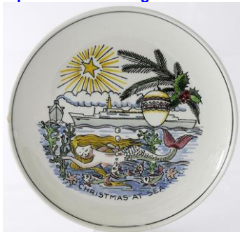
Goedewaagen, Kerst-editie; ontwerp Piet de Jong, ca 1963