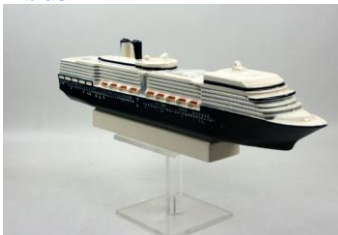
Goedewaagen, miniatuur MS Nieuw Amsterdam, 2015, l. 42 cm, ontwerp Sander Alblas