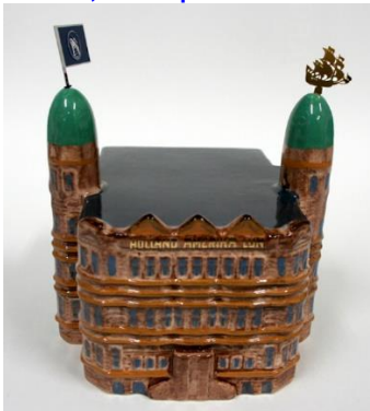
Goedewaagen, miniatuur Hotel New York, 2010, ontwerp Sander Alblas