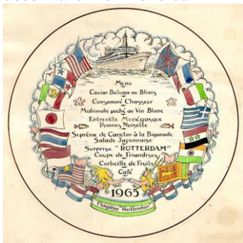
Goedewaagen, ontwerp wandbord worldcruise Rotterdam V, aquarel Piet de Jong