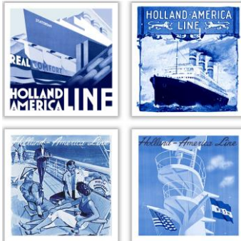
Goedewaagen Mariner-tegels, 10 x 10 cm, ontwerp Sander Alblas