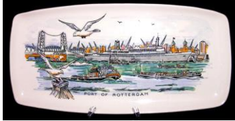
Goedewaagen, M1412, schaalte, decor haven van Rotterdam