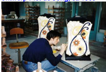
Goedewaagen, unica beschilderd door Sander Alblas voor MS Veendam, 1999