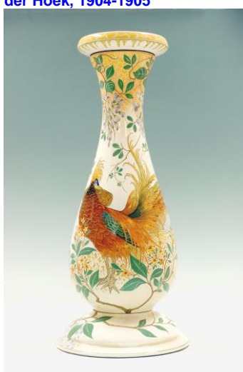
7. PZH, Piedestal, decor goudfazant, W. Hartgring, ca 1909