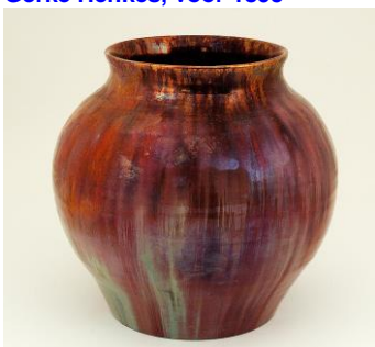
2. Porceleyne Fles, Berbas, lustervaas, ca 1895