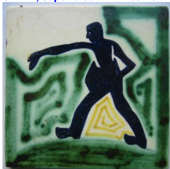
9. ESKAF, tegel, Zaaier, H. Krop

1,4,5,9 coll. B.J Baas; 2,3,6,8 coll. Fam. Branolte; 7 coll. Meentwijck