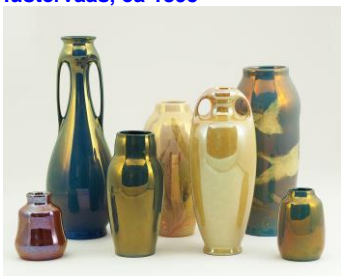
3. St. Lukas-Utrecht, lusterglazuren G. Offermans, 1909-14