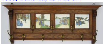
5. Potterij Rembrandt, Utrecht, eikenhouten kapstop met 4 streekdrachttegels