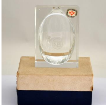
VH Meursing, persglas, ontwerp Jan van den Berg, ca 1960