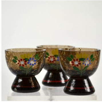
Nieuw Buinen, gedecoreerde borrelglasjes, voor 1920