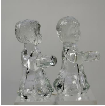
VH Meursing, jongetje- en meisje, beeldjes, na 1950