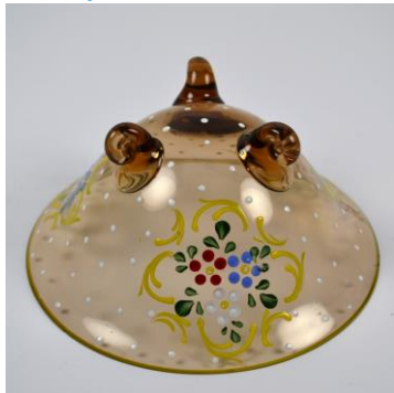
Nieuw Buinen, gedecoreerd schaalkje, onderzijde, voor 1920