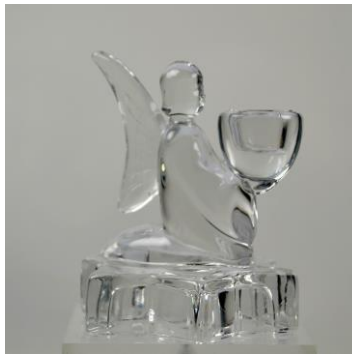
VH Meursing, kaarsenhouder, na 1950