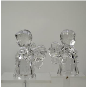
VH Meursing, engeltjes, beeldjes, na 1950