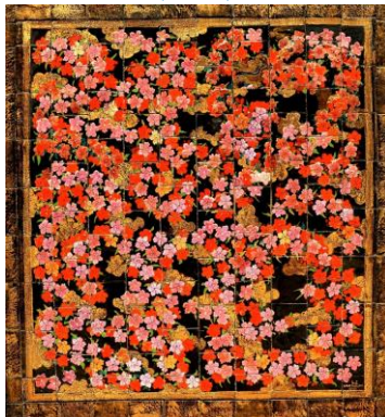
Goedewaagen, tableau SS Tjisidane, 1932, Lion Cachet