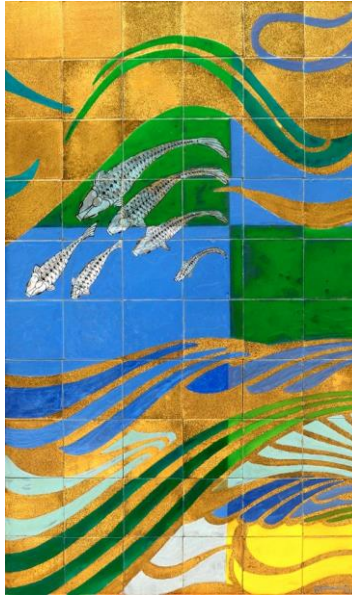
Goedewaagen, tegeltableau, ca 1934, ontwerp C.D. Kikkert