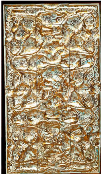
Goedewaagen, reliëftableau SS Oldebarnevelt, 1929, Lion Cachet