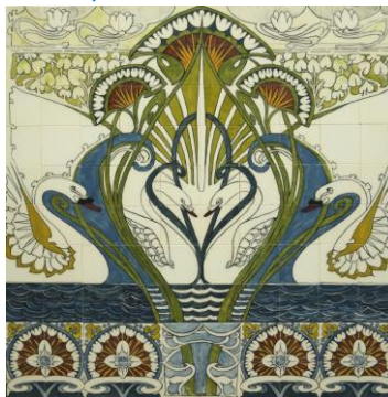
Goedewaagen, tegeltableau, 1992, schilder Gerard van Doorn, naar aquarelontwerp Bert Nienhuis, 1902