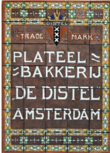
Distel, reclametableau, 1913, ontwerp C. A. Lion Cachet