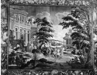
Ovidius-wandtapijt Nijmegen, na reconstruerende restauratie