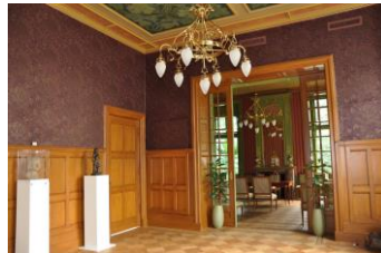
Randolph Algera: Villa Rams Woerthe – na restauratie