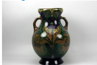
PZH-amfoor M130, na restauratie door Hanne Friederichs

Bij de Nijjaarsveziede is de entree gratis; een eventuele rondleiding om 14.30 uur kost € 5 per persoon.