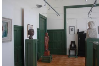
Randolph Algera: Villa Rams Woerthe, Steenwijk – voor restauratie