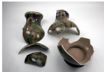
PZH-amfoor M130, in gruzelementen na ongelukkige postzending