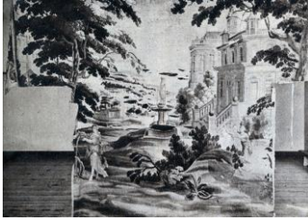
Ovidius-wandtapijt Nijmegen, uitgesneden deurpartijen weg