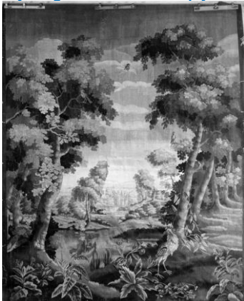
Hetzelfde wandtapijt na reconstruerende restauratie bij de Werkplaats tot Herstel van Antiek Textiel in Haarlem

Bestuur, staf en medewerkers van het Keramisch Museum Goedewaagen wensen al hun relaties een voorspoedig 2015.