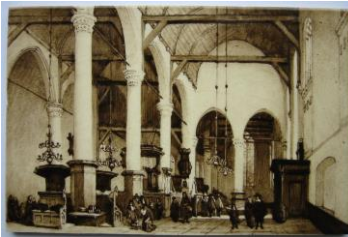
Daniël Harkink, Grote kerk naar Bosboom, coll. Bert-Jan Baas