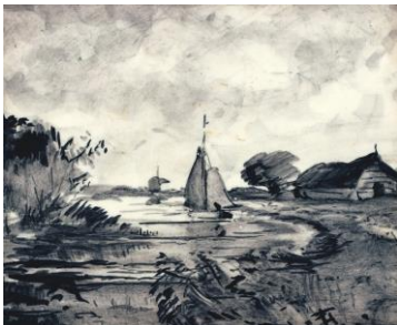
Daniël Harkink, riviergezicht, coll. Bert-Jan Baas