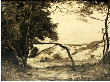
Duinlandschap, 22 x 30 cm, coll. Meentwijk