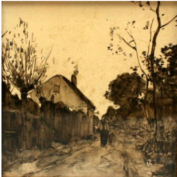
Paadje met schutting, 15 x 15 cm, coll. Meentwijk