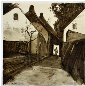
Steegje, 15 x 15 cm, coll. B-J Baas