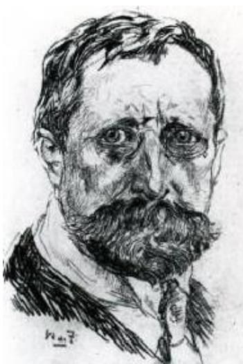
Willem de Zwart, zelfportret ca 1910