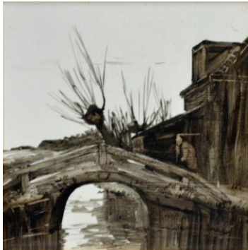
Bruggetje, 15 x 15 cm, coll. Meentwijk