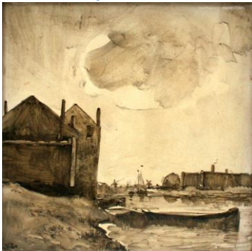
Hooiopper, 15 x 15 cm, coll. Meentwijk