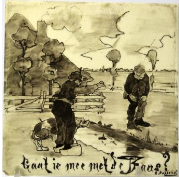
Mee met de Baas, coll. Meentwijk