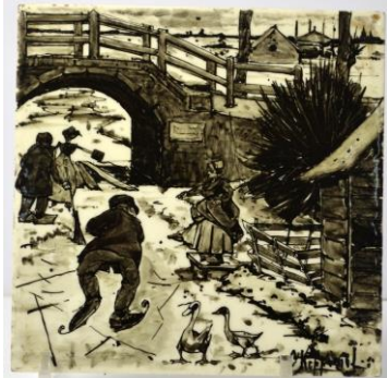
Wintertje, coll. Meentwijk