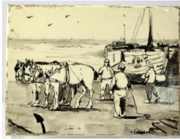
Strandgezicht bij Scheveningen