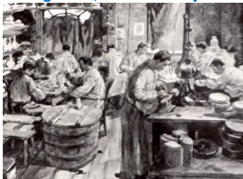
Fabrieksgezicht bij Rozenburg, aquarel, 1892