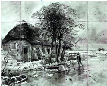
Wintertje, ca 1892, coll. Meentwijk