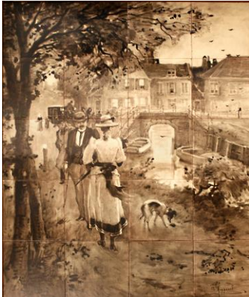
Flanerend Haags stel, ca 1892