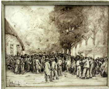
Marktgezicht, coll. Meentwijk