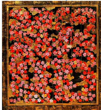
Goedewaagen, Akanhustableau Tjisdane, 1930, ontwerp C.A. Lion Cachet, coll. B.-J. Baas