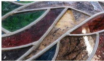
Een ander verdwenen stuk glas