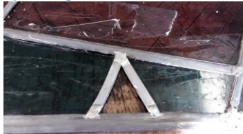
en die werd gevonden door de glasscherf in nieuw lood te zetten