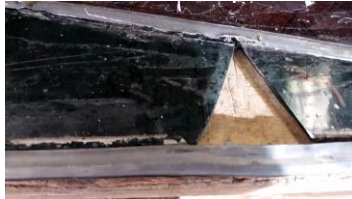
Diverse breuken in het originele glas vroegen om een stijlvolle oplossing