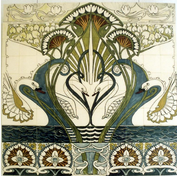
Royal Goedewaagen, tegeltableau, 1992, schilder Gerard van Doorn;; coll. Ellen Westenberg