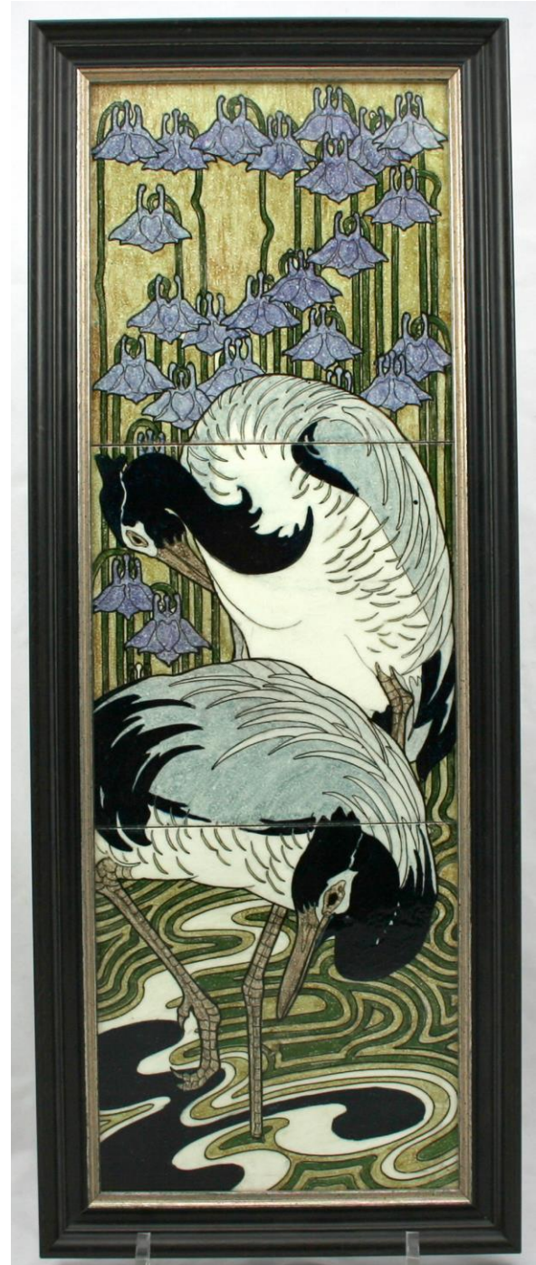
Lotus, tegelstrip, japonaiserie met kraanvogels; coll. Meentwijck (zie zaal 2, vitrine F Distel-Lotus)