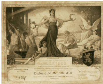
Wereldtentoonstelling Luik, 1905