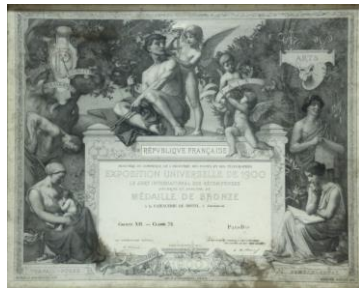
Wereldtentoonstelling van Parijs, 1900